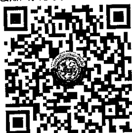
QR Code ๑ ยืนยันการเข้าร่วมการฝึกอบรม