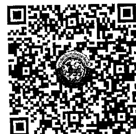
QR Code ๒ ตรวจสอบจำนวนผู้ชำระค่าลงทะเบียนแต่ละรุ่น